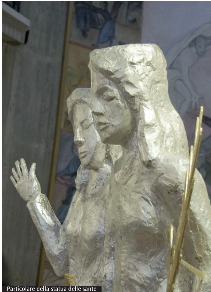
Particolare della statua delle sante

Questa è la storia che domenica pomeriggio convoca tanta gente nella parrocchia loro intitolata nella periferia di Roma. Non un rito vuoto, ma un gesto di fedeltà all'origine della chiesa portuense, un modo per essere memoria di queste radici. Rinsaldare questo legame è un impegno per tutti. Ma ai giovani è riservato un ruolo da protagonisti. Perché sono loro coetanee. Perché di loro oggi si parla sempre più in termini di problema. Invece sono risorse. Il mandato che ogni anno