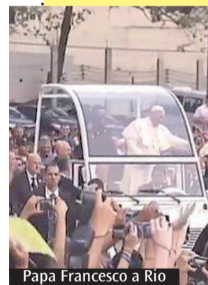
Papa Francesco a Rio

Nella memoria recente ripercorro le immagini della comunità ecclesiale di Sao Paolo in Brasile. Le famiglie che mettevano a disposizione le loro case e tutti gli spazi possibili per accogliere i pellegrini diretti a Rio di Janeiro. Come non