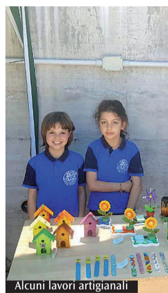
Alcuni lavori artigianali

sono dati un gran da fare per curare ogni particolare e per rendere ogni momento indimenticabile. Una giornata così bella e ben riuscita meritava certo un saluto speciale e tante lanterne sono state fatte volare nel cielo ormai buio di Roma per salutare la festa che stava terminando e dare un arrivederci a tutti per il prossimo anno con tante novità. Ma con la stessa identica voglia di stare insieme e di collaborare affinché questa piccola scuola di periferia possa diventare un posto sempre migliore. Un esempio da imitare, un luogo a cui guardare con rispetto e ammirazione, mostrando la bella collaborazione tra famiglia e scuola.