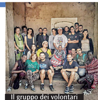
Il gruppo dei volontari

viaggi e non ti innamori dei sorrisi delle persone che incontri e del loro essere, è come se non viaggiassi veramente». Negli ultimi giorni del viaggio i ragazzi si sono riuniti per condividere le esperienze vissute. Lo stupore per la bellezza quasi incredibile di quei luoghi è stato un pensiero comune, «come lo spettacolo dei tramonti che sembrano non finire mai». La dedizione e la disponibilità nei confronti degli altri hanno reso il servizio una positiva esperienza di gratuità. Ed è proprio «imparare a donare