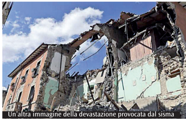
Un'altra immagine della devastazione provocata dal sisma

Il territorio terremotato, nel versante reatino, è stato suddiviso in quattro aree, di cui si occuperanno i coordinamenti regionali Caritas interessati, più Amatrice centro, affidata direttamente al Lazio. Sul posto resta operativo il presidio Caritas (con la tenda nel cortile dell'Opera Don Minozzi, in attesa di allestire una struttura fissa) con all'opera i volontari. Nazareno Boncompagni