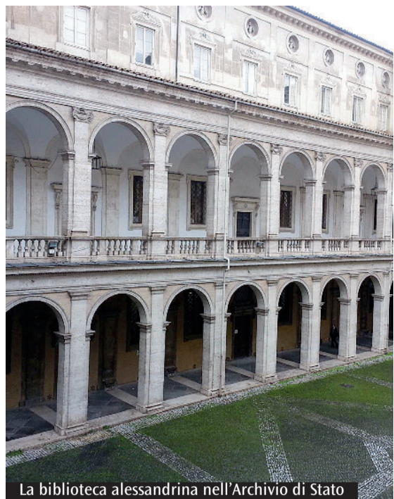
La biblioteca alessandrina nell'Archivio di Stato