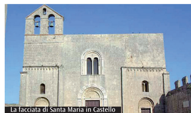
La facciata di Santa Maria in Castello

richiama la forma. Anche in città numerose sono le torri che caratterizzano il tessuto urbano, in un richiamo continuo al periodo medievale, e alle case-torri, residenze delle principali famiglie della città. Spesso queste sorsero vicino alcune delle chiese cittadine, a rivendicare il potere che una delle famiglie riusciva a detenere anche sugli spazi religiosi riservati al popolo e alla comunità.