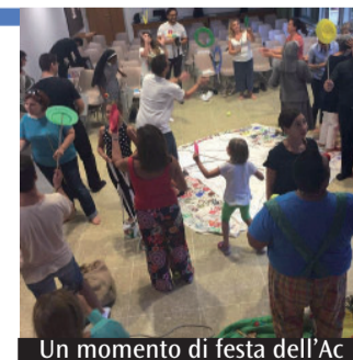
Un momento di festa dell'Ac

approvati dalla Cei che mediano i catechismi dei ragazzi, dei giovani e degli adulti. Alla presentazione di questi testi è stata dedicata la seconda parte del pomeriggio. I lavori sono stati incentrati sulle iniziative annuali per le tre fasce di età, sulla struttura delle guide e sulle attenzioni pedagogiche, educative e culturali evidenziate dai testi. Tra i prossimi appuntamenti è da segnalare la partecipazione di giovani e adulti al finesettimana formativo regionale rivolto ai neo-educatori il 15 e 16 ottobre. Le parrocchie di Parco Leonardo e Fregene hanno riconfermato la scelta