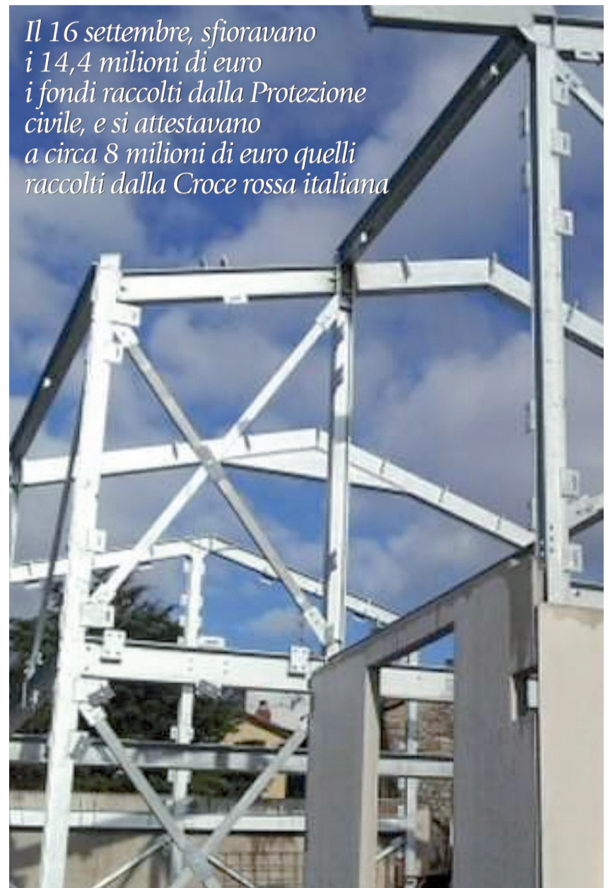
Il 16 settembre, sfioravano i 14,4 milioni di euro i fondi raccolti dalla Protezione civile, e si attestavano a circa 8 milioni di euro quelli raccolti dalla Croce rossa italiana

La Cei aderisce alla Giornata di preghiera per la pace del 20 settembre, giorno dell'incontro interreligioso di Assisi, presieduto da papa Francesco. Tutte le diocesi saranno unite in preghiera al grande evento di Assisi, a trent'anni di distanza dal primo, svoltosi il 27 ottobre 1986, a cui partecipò Giovanni Paolo II. L'iniziativa è proposta dalla Nunziatura apostolica in Italia, su invito del Papa, che nel suo ultimo messaggio per la pace ha scritto: «La pace è dono di Dio, ma affidato a tutti gli uomini e a tutte le donne, che sono chiamati a realizzarlo».