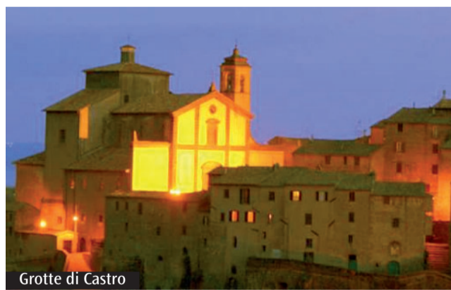
Grotte di Castro