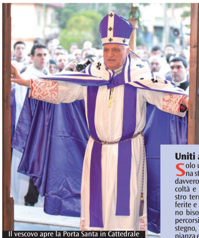
Il vescovo apre la Porta Santa in Cattedrale

I lavori assembleari saranno di ascolto e di elaborazione. All'ascolto saranno dedicati due momenti. Il primo va sotto il titolo "Per una chiesa, casa di misericordia" e si tiene nel pomeriggio di venerdì. Questa parte è affidata al cardinale Edoardo Menichelli, vescovo di Ancona-Osimo, e al vescovo Vincenzo Apicella di Velletri-Segni. Il cardinale Menichelli offrirà una meditazione sulla famiglia come scuola di misericordia. Invece il vescovo Apicella condividerà alcune prospettive che la Chiesa può recuperare dall'esperienza dell'anno santo. Il secondo momento dell'ascolto sarà proposto sabato mattina, "Porto-Santa Rufina. Tra memoria e futuro". Negli ultimi anni, e ancora oggi, la diocesi cresce regolarmente con nuove urbanizzazioni e persone che vi si trasferiscono. Le comunità parrocchiali riscontrano questo processo