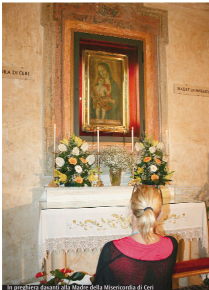
In preghiera davanti alla Madre della Misericordia di Ceri

primo vescovo della nostra Chiesa - scrive monsignor Reali - avvierà l'ultimo tratto del nostro cammino giubilare» che si concluderà con il pellegrinaggio diocesano alla tomba di San Pietro, nel pomeriggio del 15 ottobre, e con la solenne chiusura della porta santa in cattedrale, il 19 novembre.