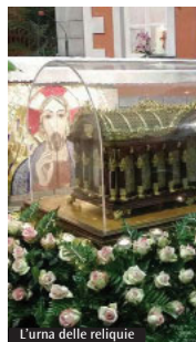
L'urna delle reliquie

bambini, alle 16.30 la testimonianza di Clotilde Martel e alle 19 si celebra la Messa. Alle 21 dopocena di catechesi su "La maternità spirituale richiesta dal Papa per i sacerdoti" con adorazione eucaristica dalle ore 23. Domenica alle ore 8 la preghiera delle lodi e alle ore 10 la Messa presieduta dal cardinale Mauro Piacenza con la venerazione delle reliquie accompagnata dalla preghiera. Alle ore 15 la coroncina della Divina Misericordia e alle ore 16.30 il saluto a Santa Teresa e la partenza delle reliquie. (Parrocchia di San Luigi Gonzaga, Via dei Dentali, 120, 00054 Fiumicino - Focene, tel. 06.65.08.81.15)