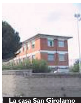
La casa San Girolamo

L audato sia il lavoro» è il titolo del Campo Nazionale del Movimento Lavoratori di Azione Cattolica che quest'anno si terrà nel Lazio, ad Ariccia, presso la Casa San Girolamo dei Padri Somaschi, dal 17 al 21 agosto, ed avrà per tema una verifica del "jobs act" ad un anno dalla sua promulgazione, fatta alla luce dell'ecologia integrale della Laudato Si' , in continuità col lavoro avviato nel campo nazionale dello scorso anno. A questo percorso di approfondimento si accompagnerà un'analisi della quarta rivoluzione industriale e delle sue ricadute sociali, per capire come si va trasformando il mondo del lavoro. Faranno da guida