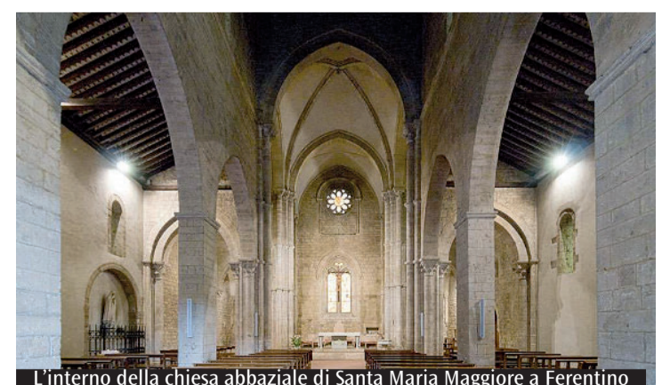
L'interno della chiesa abbaziale di Santa Maria Maggiore a Ferentino

sgretola, perfino il cemento armato della casa di fronte. Qui forse passò Luigi VII, Re di Francia, di ritorno dalla disastrosa crociata indetta da Eugenio III e da San Bernardo da Chiaravalle, che dimorò nel caldo scrigno cistercense della città. Chissà magari custodendo gelosamente il Sacro Lenzuolo della Passione. Fra storia e mito, in questo pezzo di Ciociaria solcata da due città belle come il sole come Alatri e Ferentino ancora una volta il Lazio antico con le sue opere e i suoi terrazzamenti fatti di mura poligonali ci