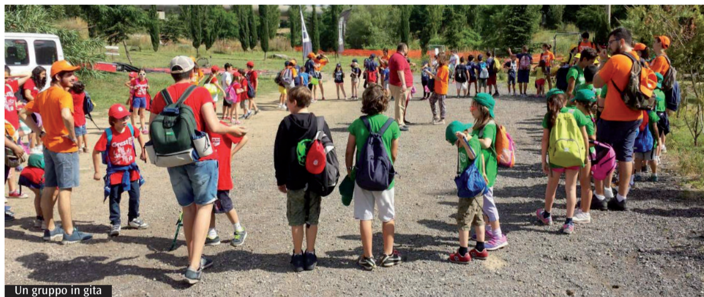
Un gruppo in gita

questo aspetto si unisce poi l'impegno lavorativo che coinvolge entrambi i genitori. Non vanno però escluse le fragilità di molti nuclei familiari che vivono esperienze di separazioni o divorzi, con il singolo genitore non in grado di occuparsi da solo dei figli. Ma la diffusione dei GrEst non risponde solo alla crescente richiesta di accoglienza. Le comunità sono impegnate a potenziarli perché si sono rivelati un potente strumento educativo rivolto ai giovani animatori. Tra di essi c'è sempre la presenza attiva del parroco aiutato da un gruppo di adulti, spesso mamme e papà, che si affianca e coordina il gruppo dei più giovani. Così, ragionando insieme e progettando le attività, gli adulti trasmettono ai ragazzi capacità organizzativa e senso di responsabilità verso i più piccoli. Peraltro nulla è improvvisabile. Non sono rari i percorsi di formazione proposti durante l'anno, e in ogni caso gli educatori sono per la maggior parte gli stessi che animano l'oratorio da settembre a maggio. È una strada educativa importante, che