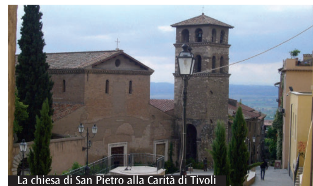
La chiesa di San Pietro alla Carità di Tivoli

mo cipollino che un tempo dividevano la navata centrale da quelle laterali, «svendute» al cardinal Alessandro Albani sul finire del Settecento alla «modica» cifra di 265 scudi. In questo fazzoletto della città la chiesa di San Silvestro testimonia come l'ampliamento di un quartiere passò attraverso l'erezione di una nuova chiesa per i fedeli. Questo raccontano gli studi sull'urbanistica della città e sulla storia della basilica. Ma cosa c'è di vero? Nel V secolo Tivoli assunse grande importanza presso la curia romana, anche grazie all'elezione al soglio di Pietro di papa Simplicio, il primo papa tiburtino. Si può pensare che una delle tante chiese fatte edificare dal pontefice possa custodirsi sotto l'attuale, nelle fondamenta di questo edificio troppo ricco e prezioso