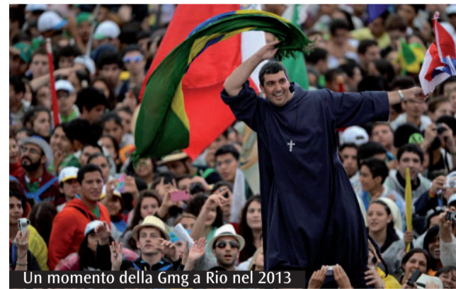
Un momento della Gmg a Rio nel 2013