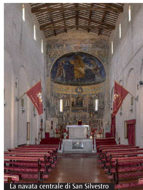
La navata centrale di San Silvestro