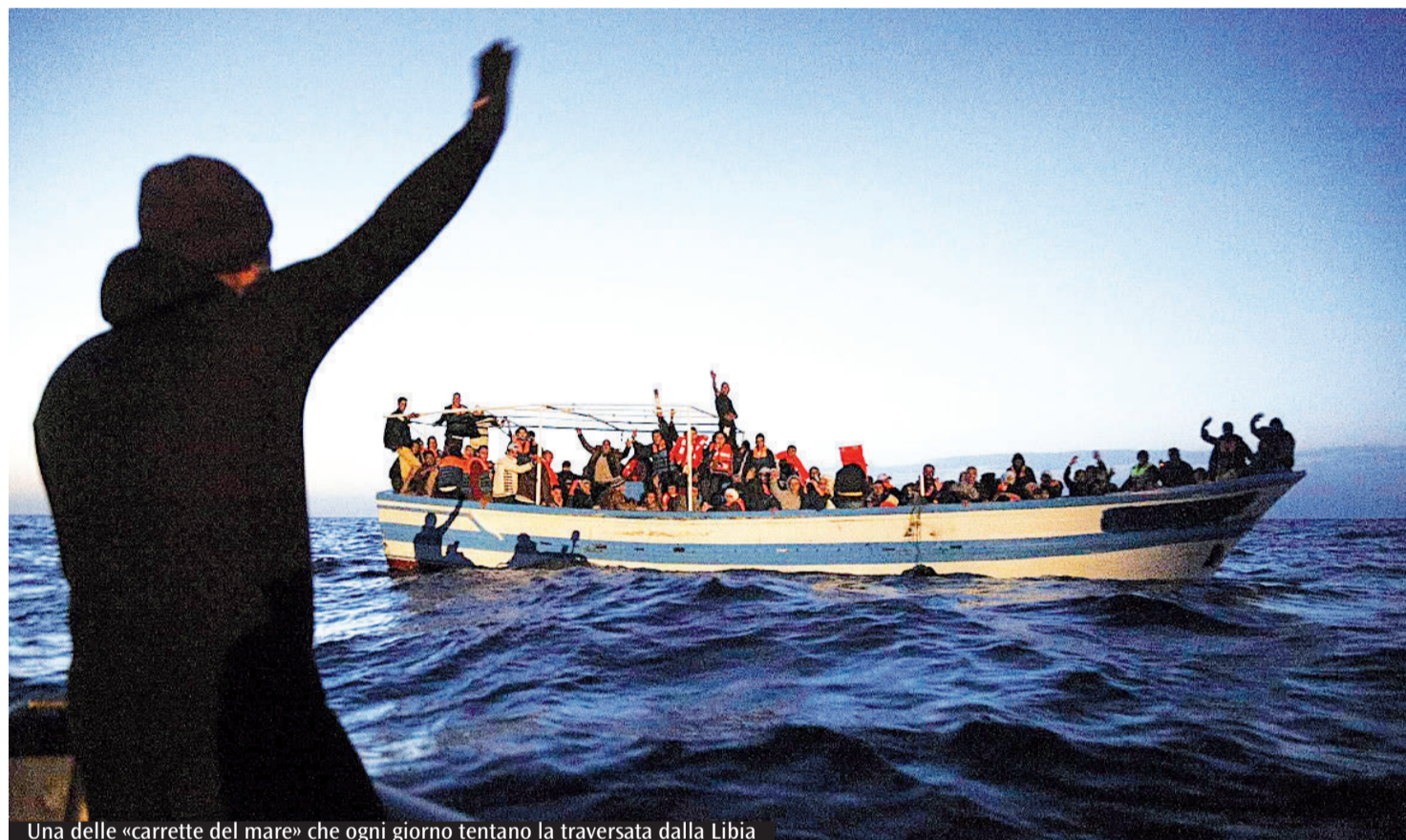
Una delle «carrette del mare» che ogni giorno tentano la traversata dalla Libia

Nella diocesi di Frosinone-Veroli-Ferentino, per iniziativa del Vescovo Ambrogio Spreafico, e per azione dell'Ufficio Scuola, della Migrantes e della Caritas, si è concentrata sul mondo della scuola, promuovendo un percorso di formazione di incontri, rivolto ai docenti sul tema delle migrazioni per promuovere iniziative didattiche rivolte agli studenti sui temi della mobilità umana e della cultura dell'incontro nell'anno scolastico 2015-2016. Un contributo sicuramente importante per l'integrazione, che non solo è possibile - come dimostrano iniziative in tutt'Italia - ma è l'unica strada. Diversamente si alimenta conflittualità, divisione, violenza, povertà: parole