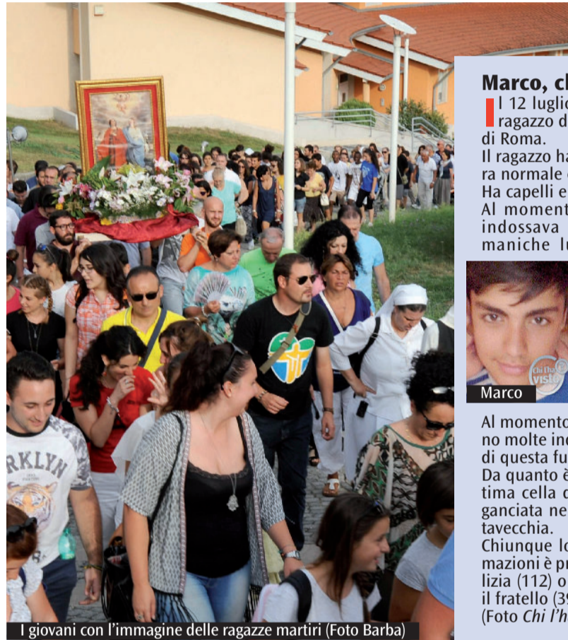
I giovani con l'immagine delle ragazze martiri

La celebrazione inizia. Don Amleto riconduce tutti al senso di questo stare insieme e nell'omelia sottolinea l'importanza della loro memoria, quasi come un compito che s'impone ai fedeli della Chiesa portuense. Come i romei che arrivati a Monte Mario baciavano la terra in omaggio al sangue versato dai testimoni della fede, «anche noi dovremmo chinarci e baciare questa terra. Sì, proprio questa, perché qui Rufina e Seconda hanno confermato la loro fedeltà con la vita. Due giovani della vostra età e per le quali voi siete mandati ad annunciare Cristo», dice rivolgendosi ai ragazzi che partiranno per la Giornata mondiale della gioventù di Cracovia e per le missioni in Africa e in Romania. «E tornando dovrete essere testimoni per noi di quello che avete vissuto». Lo spazio è poco e i ragazzi sono raccolti nell'aiuola centrale. Al momento del mandato escono uno ad uno. Sembra quasi che provengano da quel "Buxo", quel bosco che ha raccolto i corpi esanimi delle sante. Stanno lì tra assemblea e il delegato del vescovo per confermare la loro fede e ricevere il segno che dice la loro unità e appartenenza alla Chiesa di Porto-Santa Rufina. «Siate testimoni - conclude don Amleto - della nostra storia di accoglienza e di fraternità cristiana fondata sul martirio delle giovani Rufina e Seconda di cui oggi celebriamo la memoria».