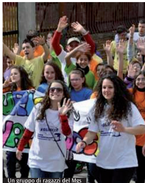
Un gruppo di ragazzi del Mgs