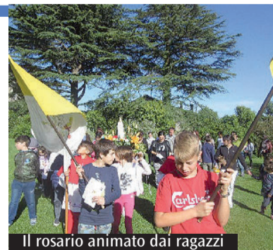
Il rosario animato dai ragazzi

a Roma per far visita al Papa. Per aiutare i piccoli a vivere l'anno santo il parroco legge e spiega le parabole di Gesù dove è approfondita la misericordia. E suggerisce di prendere un impegno quotidiano da seguire per crescere nel rapporto tra con gli altri. Oltre al gioco, al ballo e alla preghiera, ogni venerdì si fanno le gite. Allo Snowpark poco distante alla parrocchia romana, a Villa Celimontana e in piscina a Fiumicino. Il GrEst non è solo un'occasione per divertirsi, è un modo per conoscere tanti nuovi amici, per primo Gesù che è il miglior amico di tutti noi. «Credo di parlare a nome di