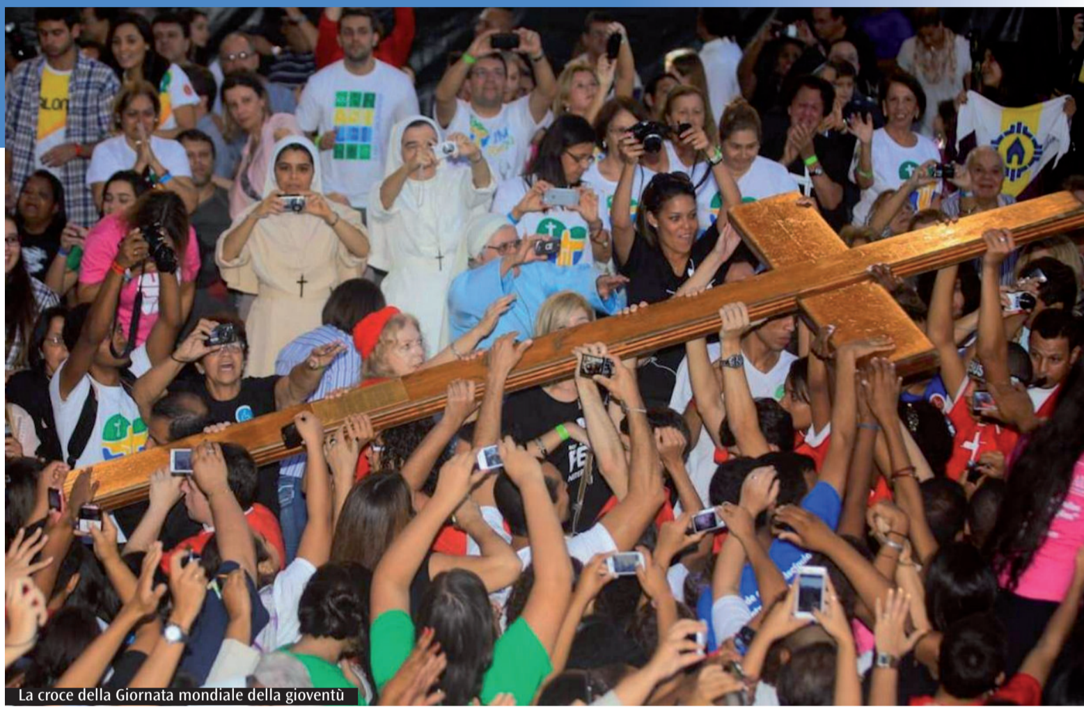
La croce della Giornata mondiale della gioventù