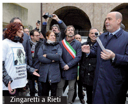
Zingaretti a Rieti

integrato, finanziato coi fondi europei del Por-Fesr che coinvolge 16 comuni. 150 nel complesso gli interventi finanziati, per un ammontare originario di 113 milioni di euro, cui se ne sono aggiunti altri 8,9 per lo sviluppo di interventi immateriali. A Rieti Zingaretti ha anche incontrato rappresentanti dei lavoratori e poi un incontro in Prefettura i sindaci della provincia sabina. (n.b.) (altro servizio a pagina 12)