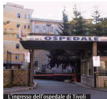
L'ingresso dell'ospedale di Tivoli

Gli interventi riguarderanno venti nosocomi, sette dei quali a Roma e gli altri tredici nelle diverse province