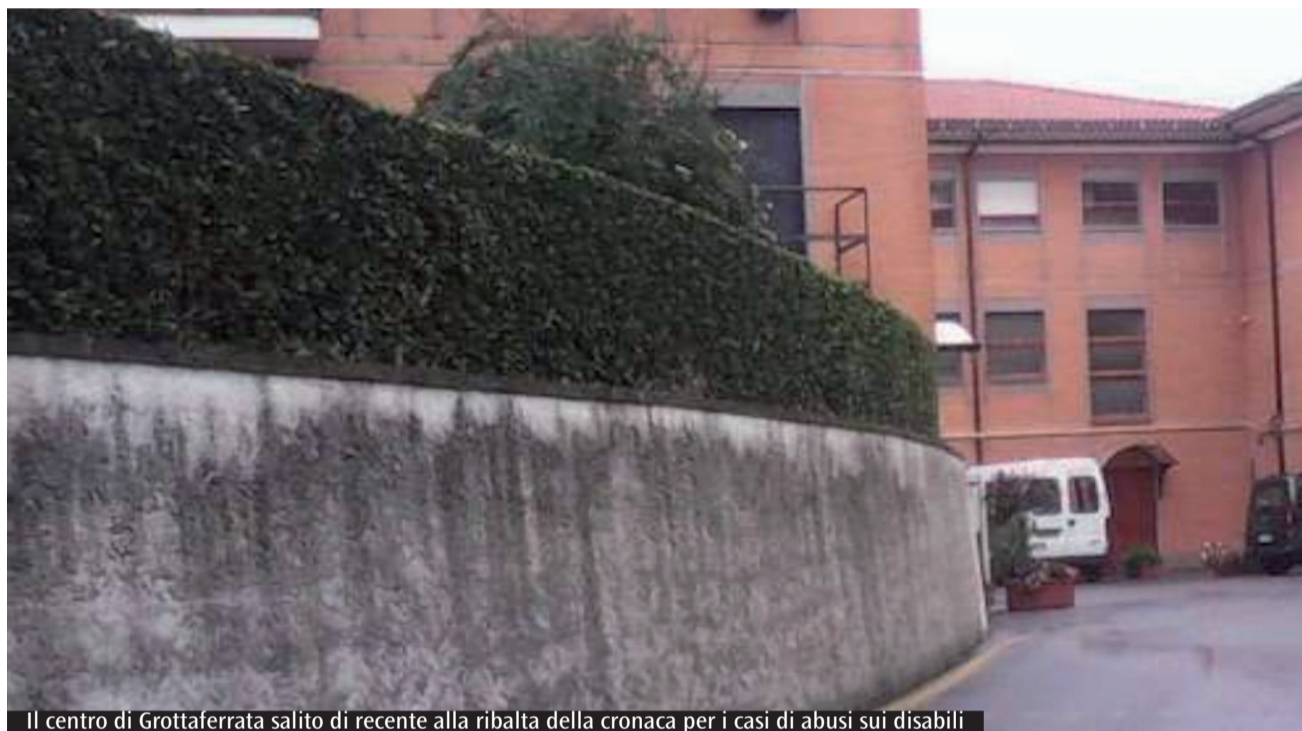
Il centro di Grottaferrata salito di recente alla ribalta della cronaca per i casi di abusi sui disabili

e indotto a prostituirsi dei minori. Donne, minori, anziani e disabili dunque, nessuno escluso dalla spirale di violenza. Una sola domanda rimane a chi si trova di fronte a queste nefandezze. Perché?