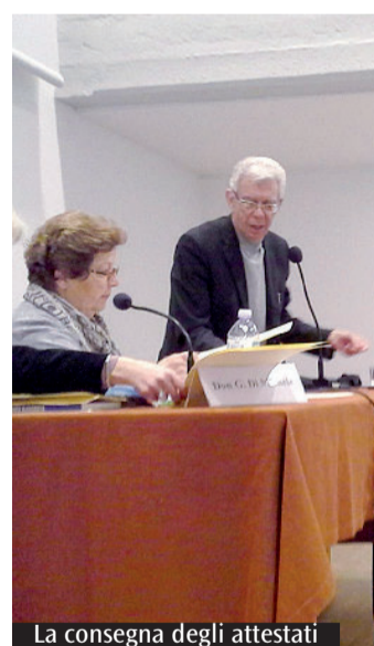
La consegna degli attestati