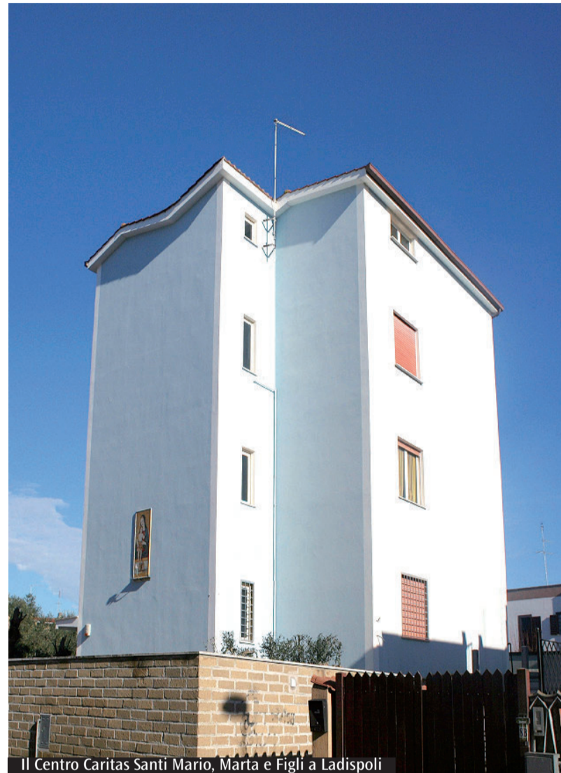
Il Centro Caritas Santi Mario, Marta e Figli di Ladispoli

(Via Enrico Fermi, 10 - 00055 Ladispoli (RM)) entro e non oltre le ore 12 del 29/3/2016, esclusivamente con le seguenti modalità: consegna a mano, dal lunedì al venerdì, dalle ore 10.00 alle ore 12.30 (fatta eccezione per martedì 29 marzo, in cui il termine di accettazione delle domande è fissato per le ore 12); o con raccomandata a/r (fa fede la data di arrivo e non di invio), all'indirizzo: Caritas Porto-Santa Rufina - "Progetto L'Ora Undecima" - Via Enrico Fermi, 10 - 00055 Ladispoli (RM). L'informativa del progetto e la domanda di ammissione possono essere ritirate insieme, in formato cartaceo, presso il Centro Santi