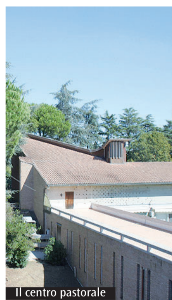
Il centro pastorale

sono anzitutto christifideles, chiamati a svolgere un servizio non solo in base a criteri tecnici ed economici, ma anche in riferimento a principi di ordine specificamente ecclesiale, primo fra tutti quello dei fini propri dei beni della Chiesa. L'impegno del parroco e del Cpae nella buona amministrazione assume ancora più rilevanza nel reimpiego delle somme a disposizione. È infatti compito fondamentale di ogni comunità parrocchiale la testimonianza sul territorio riservando particolare attenzione ai poveri e alle opere di misericordia. (Il programma e la scheda di iscrizione, che dovrà pervenire in curia entro il 26 febbraio, sono disponibili sul sito diocesano).