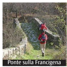
Ponte sulla Francigena