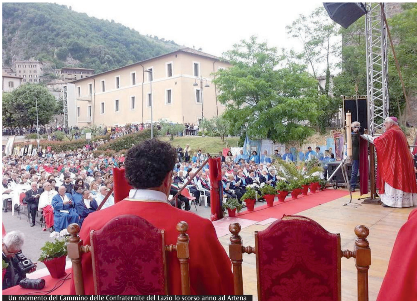
Un momento del Cammino delle Confraternite del Lazio lo scorso anno ad Artena