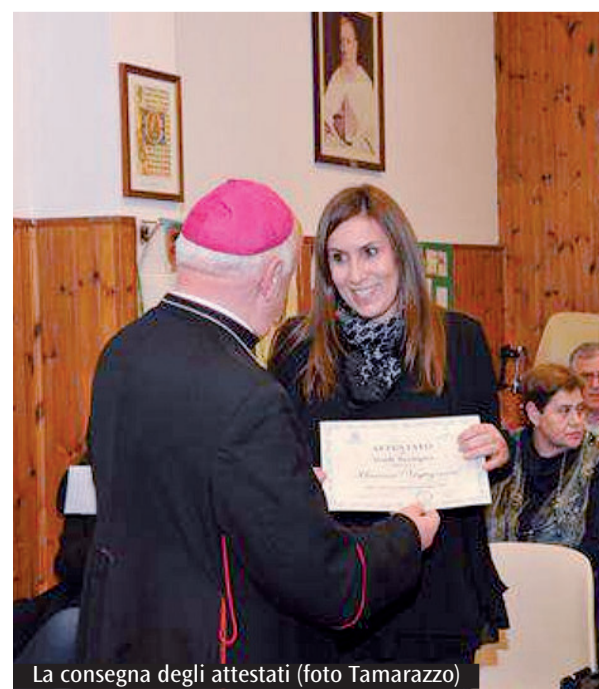
La consegna degli attestati