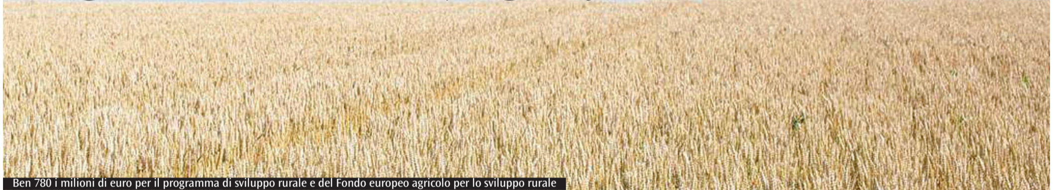
Ben 780 i milioni di euro per il programma di sviluppo rurale e del Fondo europeo agricolo per lo sviluppo rurale