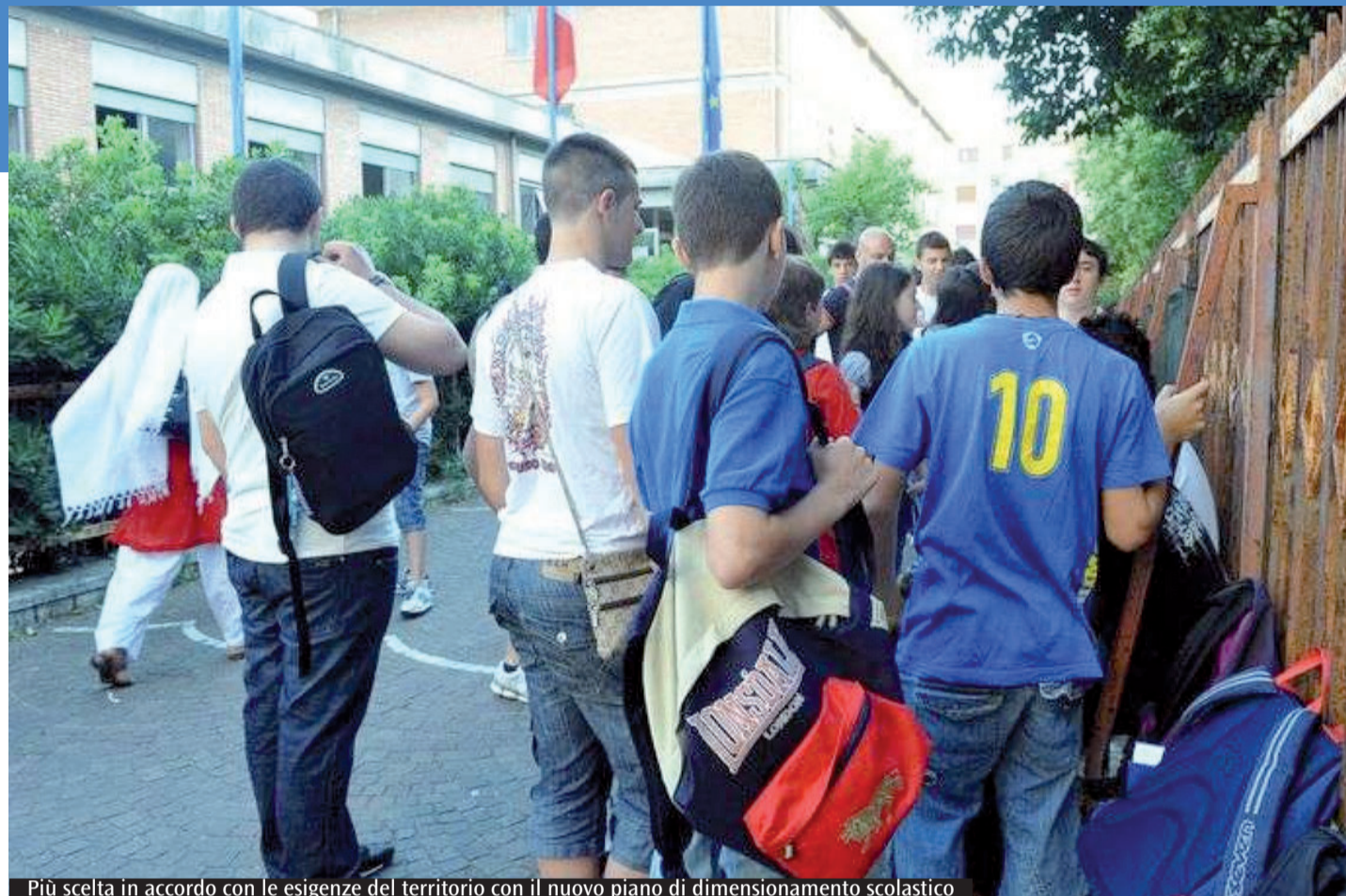
Più scelta in accordo con le esigenze del territorio con il nuovo piano di dimensionamento scolastico

affidamento del servizio – ha continuato Visini –. Tutto sarà dato in gestione a un'organizzazione del Terzo settore con esperienza specifica nel campo della mediazione penale minorile. Tra pubblicazione del bando, esame delle domande e graduatoria ci vorranno tre mesi: credo che dal 1 aprile il Centro potrà cominciare a lavorare». Ha commentato l'iniziativa anche Melita Cavallo, ex presidente del Tribunale dei minori di Roma ed ex parlamentare. «Parliamo di ragazzi autori di reati anche gravi e che avvengono soprattutto in ambito familiare – ha detto –. L'obiettivo principale è diminuire la recidiva».