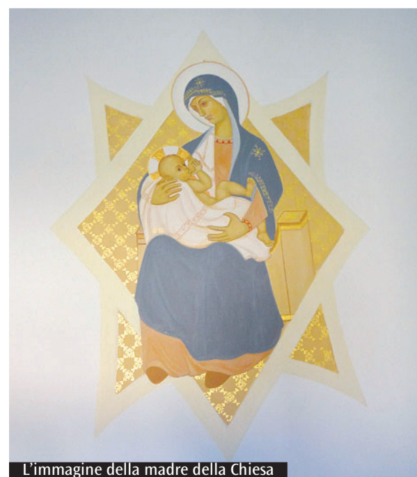
L'immagine della madre della Chiesa