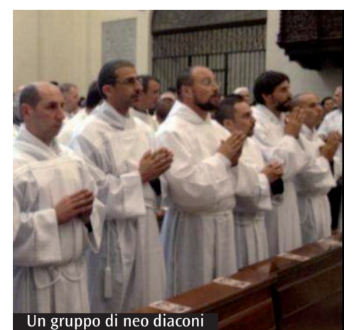
Un gruppo di neo diaconi

fermato. Questa realtà mi fa interrogare sia sulla qualità della testimonianza dei diaconi in questi primi decenni sia sulle modalità della formazione e dello stesso discernimento vocazionale di chi è stato chiamato a questo servizio. Confesso, però, che le testimonianze che dalle varie diocesi sono state proposte sono il segno evidente di quanto il servizio dei diaconi seppur nascosto sia capace di scrivere nel quotidiano belle pagine di vita cristiana portando nei luoghi della vita ordinaria il segno sacramentale del Cristo Servo. Senza diaconi, presbiteri e vescovi dirà, infatti, Sant'Ignazio, non c'è Chiesa. Credo, allora, che questa semplicità, essenzialità e verità deve sempre più impegnare la vita della Chiesa che per rispondere con sempre maggiore fedeltà