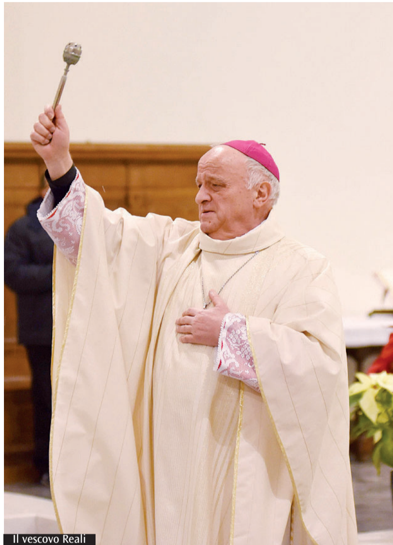
Il vescovo Reali

sapienza perché ci manca - dice nella festa di Maria Santissima -. Noi non siamo sapienti anche se spesso ci mettiamo in cattedra ad insegnare, e talvolta ci comportiamo come se fossimo padroni del mondo». E poi «chiediamo la forza, perché ci sono da fare scelte coraggiose: non è facile scegliere il bene, non è facile lottare contro il male, in ogni sua forma, non è facile custodire la speranza». Infine «Chiediamo oggi un cuore compassionevole, capace di diventare un terreno fertile perché il bene possa crescere, e possa maturare nel mondo perché, ricordiamolo, è il bene che genera il bene e così ognuno di noi può contribuire alla crescita del bene per