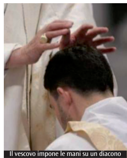
Il vescovo impone le mani su un diacono

L'inchiesta condotta nelle comunità laziali, oggi alla sua ultima puntata, dimostra quanto diaconi, sacerdoti e vescovi siano essenziali per la vita di fede. Il servizio diaconale, compito che conserva una propria specificità