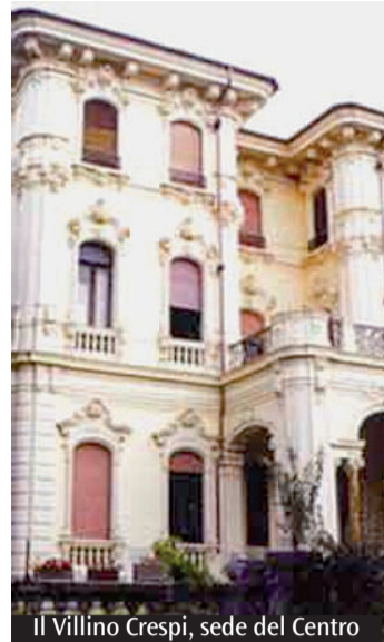
Il Villino Crespi, sede del Centro