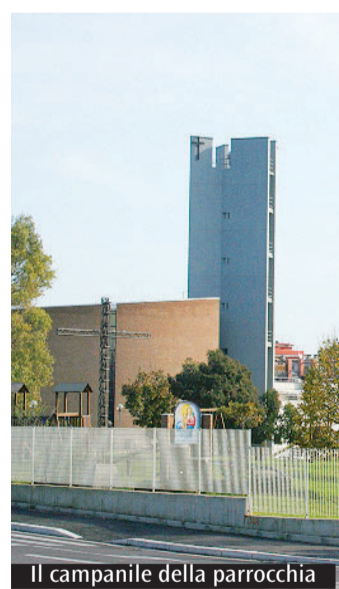
Il campanile della parrocchia