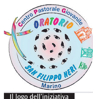
Il logo dell'iniziativa