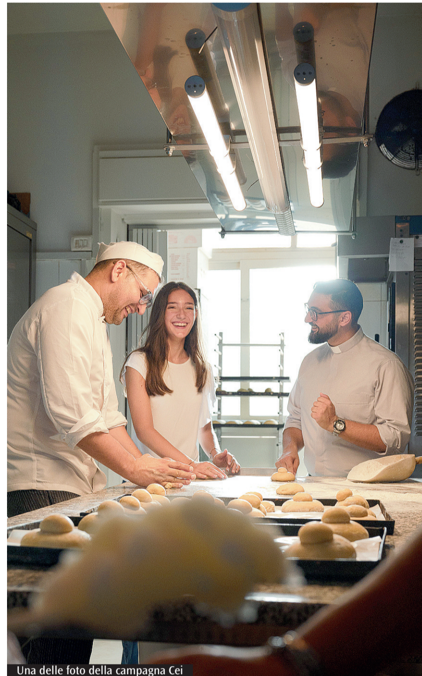
Una delle foto della campagna Cei

Al via la nuova campagna della Chiesa cattolica, on air dal primo dicembre fino a fine gennaio