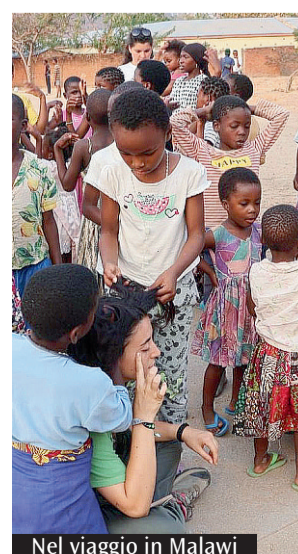
Nel viaggio in Malawi

effettuate utilizzando l'iban IT05S0878739091000000081044), nella serata i volontari illustreranno altre iniziative come le bomboniere solidali e l'offerta per i prodotti "Just in Africa!". Per partecipare alla cena è necessario prenotarsi, visto che i posti sono limitati, contattando il numero 3392709046. Per ogni informazione e rimanere aggiornati sulle iniziative c'è la mail: info.cmdportosantarufina@gmail.com, la pagina Facebook: @CMDPortoSantarufina e l'account Instagram: cmd_portosantarufina. La parrocchia di Selva Candida è a Roma in via Santi Martiri di Selva Candida, 7. Simone Ciamparella