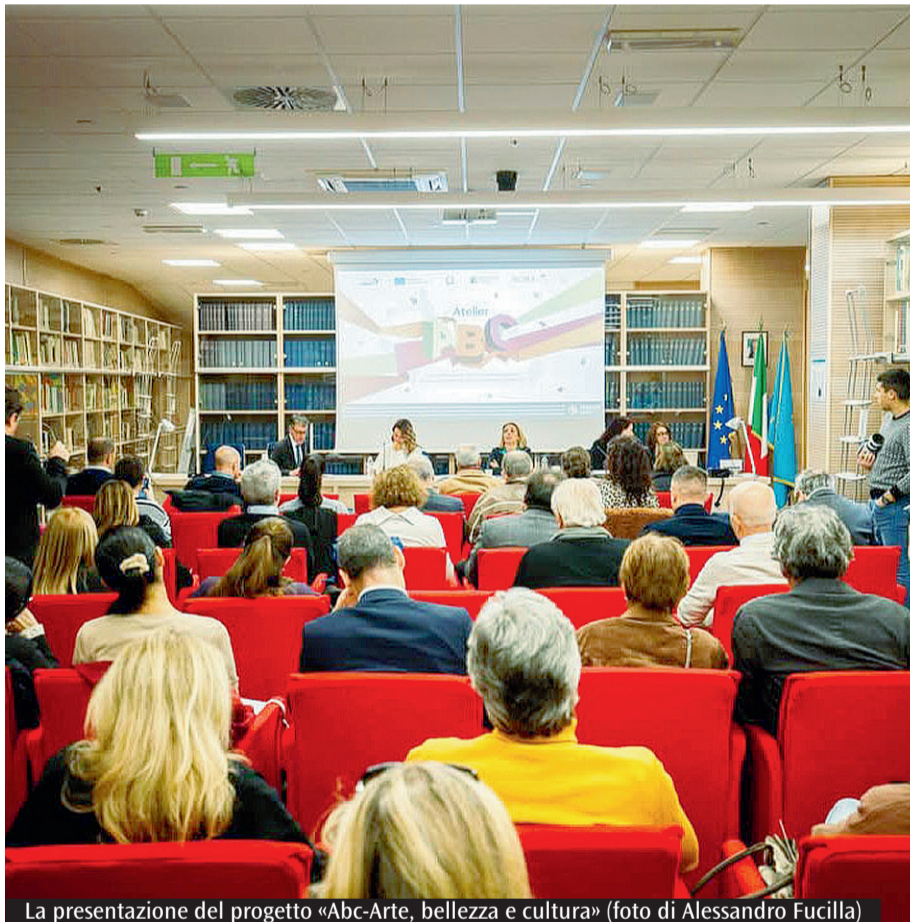
La presentazione del progetto «Abc-Arte, bellezza e cultura»