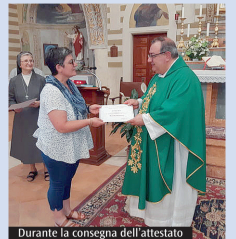
Durante la consegna dell'attestato