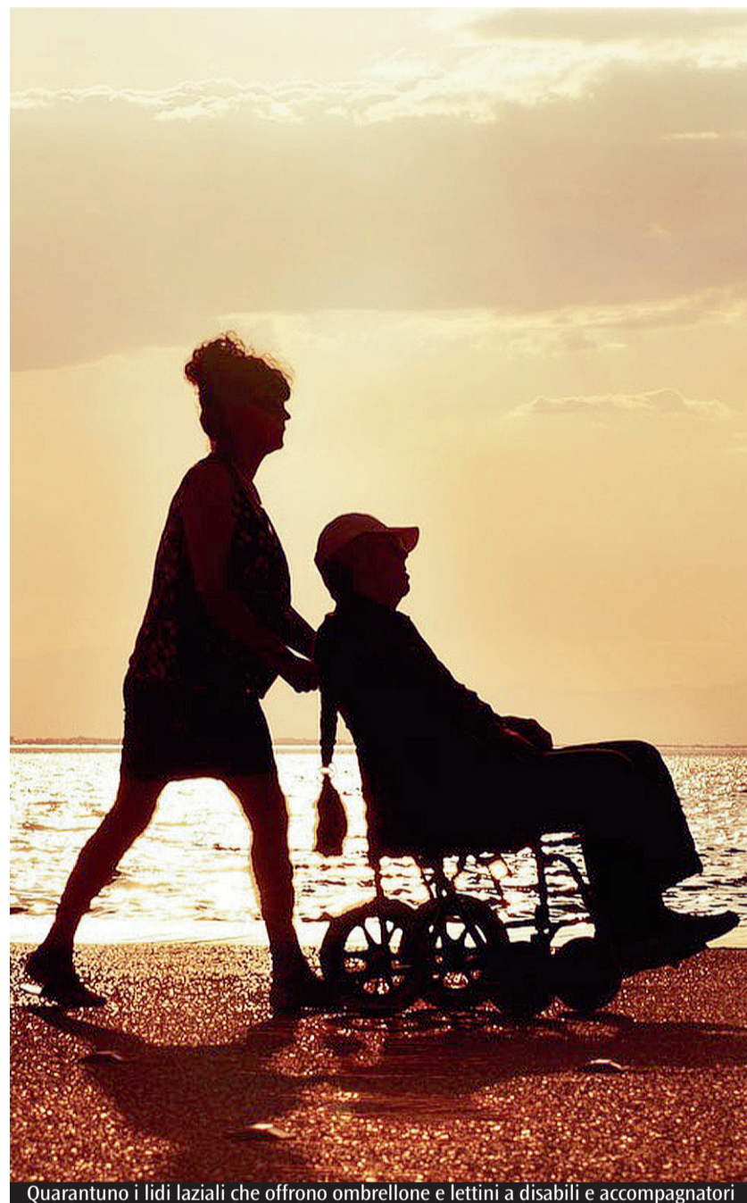
Quarantuno i lidi liaziali che offrono ombrellone e lettini a disabili e accompagnatori

Regione Lazio, Guardia costiera e associazioni rendono più inclusive le spiagge del Lazio