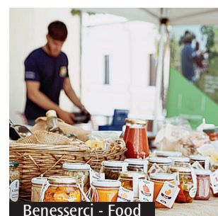
Bennesserci - Food

unisce le comunità di San Felice e di Sabaudia e che ha appena centrato la promozione in prima divisione maschile vincendo il campionato. Per quanto riguarda invece la giornata clou di sabato 29 giugno, in mattinata, presso