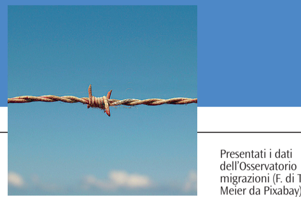
Presentati i dati dell'Osservatorio migrazioni