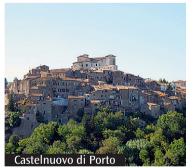
Castelnuovo di Porto

«Paesaggi dell'Utopia» è il tema del festival «Castelnuovo Fotografia» che è stato in programma da ieri e durerà fino a domenica prossima con diversi eventi che esplorano le forme dell'arte fotografica e momenti di confronto. «Forma di utopia - si legge nella spiegazione del titolo scelto -, descrizione fantastica, solo apparentemente reale, potrebbe definirsi la fotografia che conferisce una certa forma all'immaginazione, dirigendo lo sguardo su luoghi utopici ma anche distopici, fissando nel tempo un futuro più o meno nitido, difficile da realizzare ma non impossibile». L'undicesima edizione torna ad essere ospitata nella Rocca Colonna di Castelnuovo di Porto