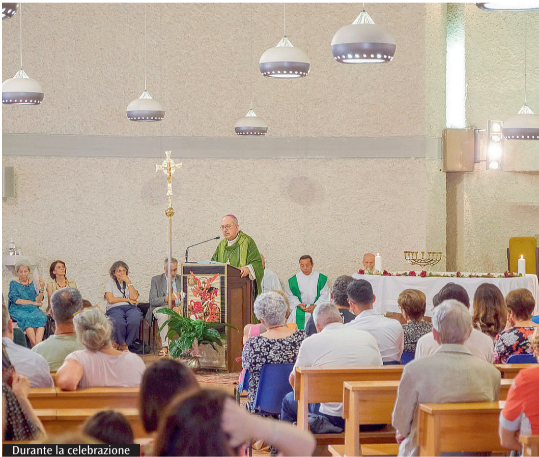
Durante la celebrazione

famiglia, che abitavano lontano, (santa Francesca Cabrini) che si spendevano per parlare di Cristo Monica decide di iniziare il cammino, grazie al quale pur nelle ferite familiari riesce a mantenere salda la sua fedeltà a Cristo. Infine, la gratitudine di Pasquale è per tutta la meraviglia che il Signore gli offre, lui che non poteva che festeggiare il suo 81 compleanno assieme ai fratelli di comunità, alla Chiesa e «al nostro vescovo che oggi ci ha