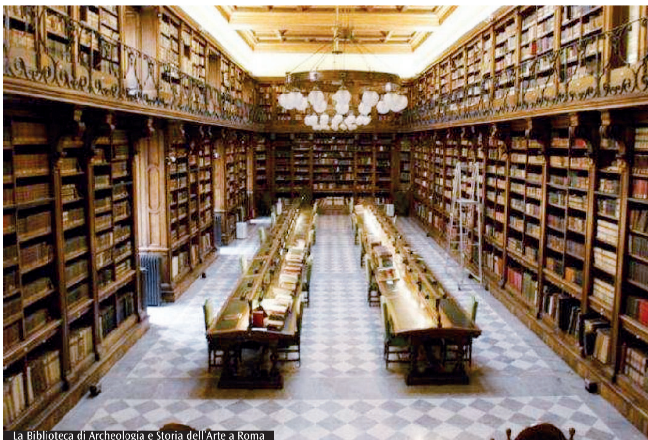
La Biblioteca di Archeologia e Storia dell'Arte a Roma

Festival «L'albatros» per la letteratura di viaggio, istituito dal Comune di Palestrina (RM); il «Cubo Festival» della Città di Ronciglione (VT); il Festival «Pagine a colori... 0-99» del Comune di Tarquinia (VT). Tra le altre iniziative vincitrici del bando, oltre alle molte presenti sul territorio di Roma e dintorni, interessanti anche quelle presenti nelle altre province: a Viterbo il progetto «Librimmaginari» dell'ARCI - Comitato provinciale di Viterbo, a Rieti l'Associazione Amici di Liberi sulla carta per la «Fiera liberi sulla carta». In provincia di Latina riceveranno finanziamenti dal bando i progetti «Un libro per tutti» (biblioteca per bambini) del Comune di Fomina e