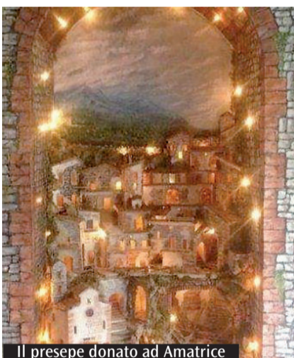
Il presepe donato ad Amatrice