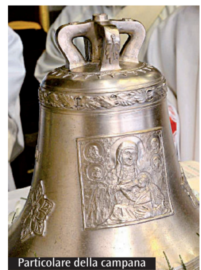
Particolare della campana

Benedizione della campana e della lapide marmorea che ricorda l'apertura dell'Anno della Misericordia