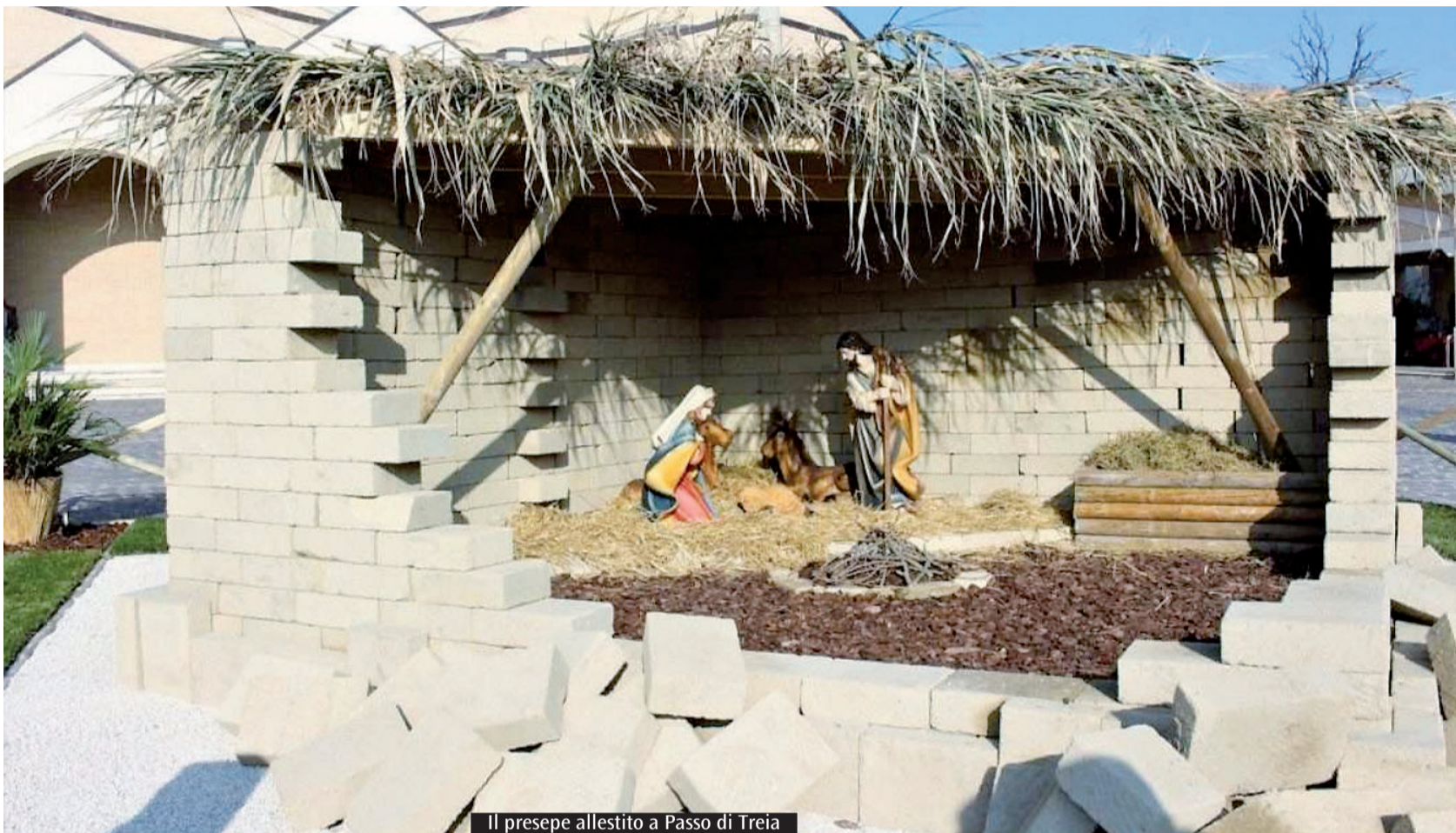
Il presepe allestito a Passo di Treia