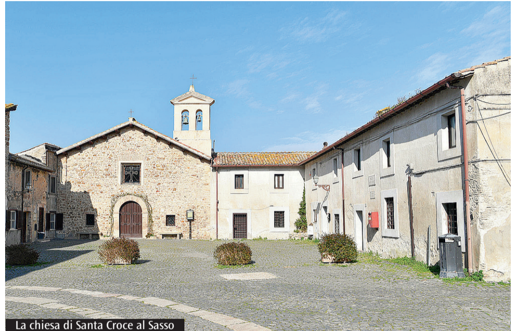
La chiesa di Santa Croce al Sasso