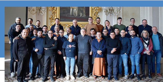
Il gruppo dei partecipanti all'incontro