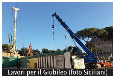
Lavori per il Giubileo