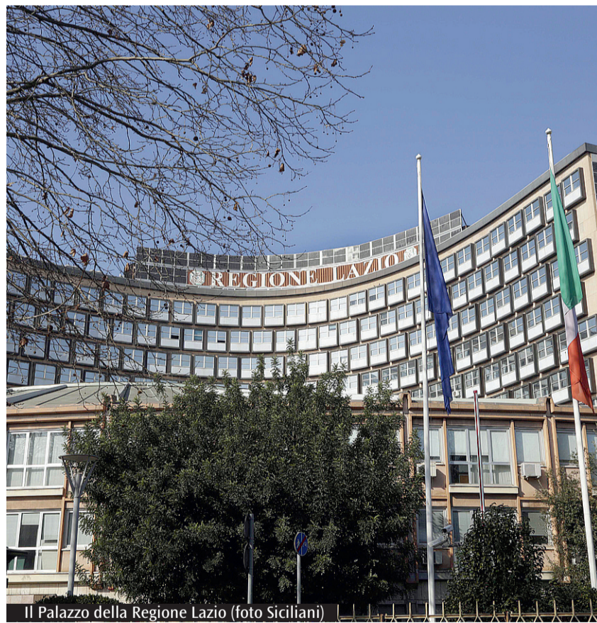
Il Palazzo della Regione Lazio