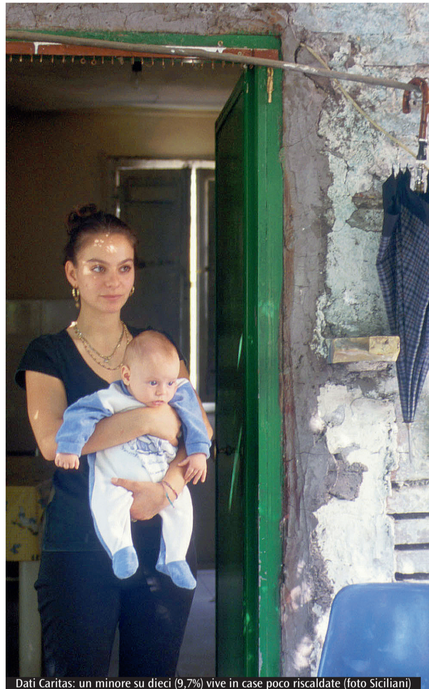
Dati Caritas: un minore su dieci (9,7%) vive in case poco riscaldate

Ricorre oggi l'VIII Giornata mondiale dei poveri. Il report della Caritas: lo è il 9,7% degli italiani