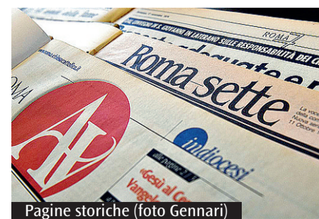
Pagine storiche